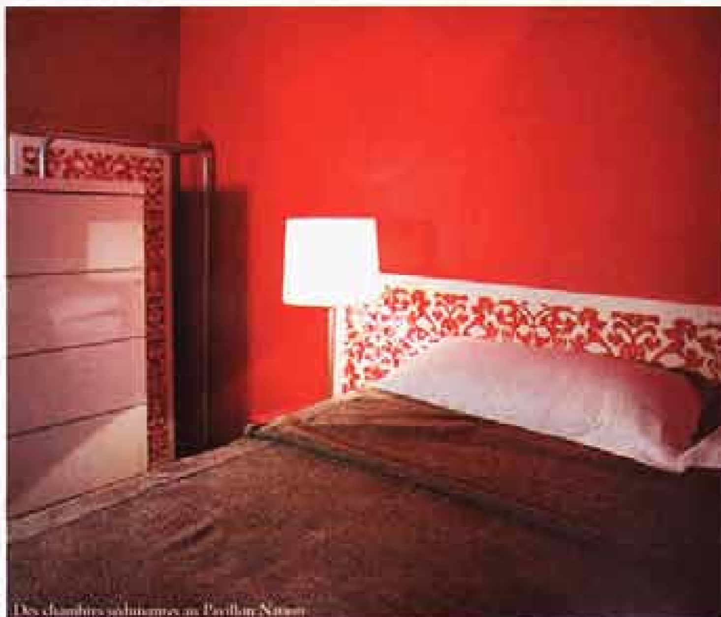
Des chambres séduisantes au Pavillon Nation

Tél. 01 55 25 36 90 - Ch. de 120 à 200€.